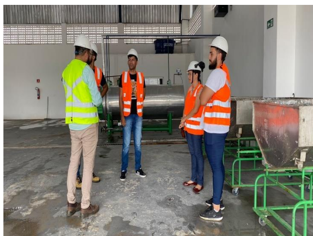
Figura 7- Visitas na CTR