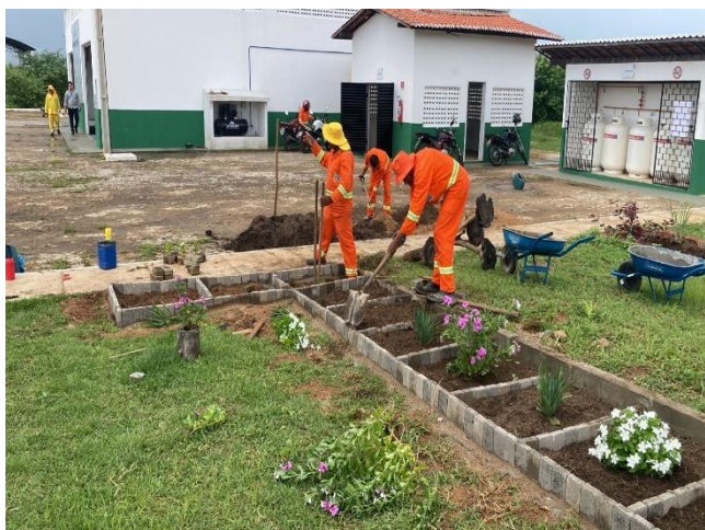
Figura 4- Manutenções dos jardins