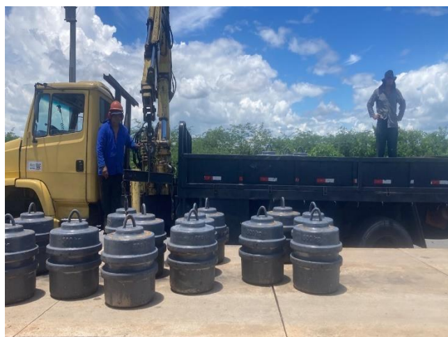
Figura 5- Serviço de Calibração das balanças