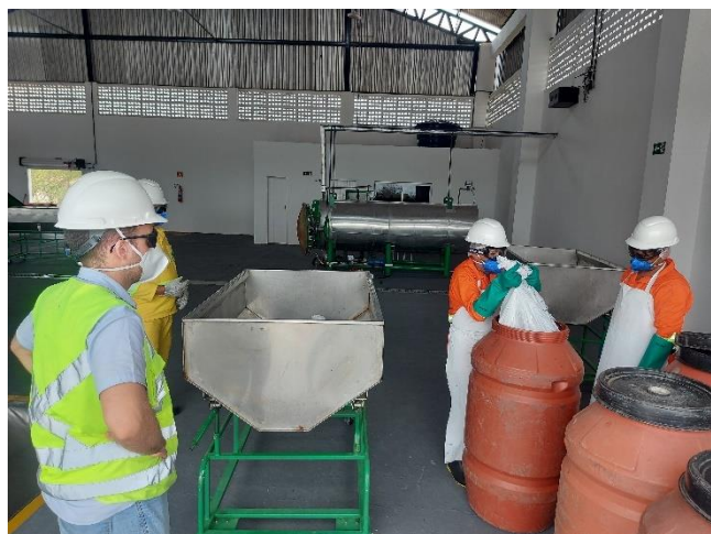
Figura 20- Início da Operação do setor da RSS