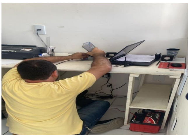
Figura 12- Instalação de baterias na balança da CTR.