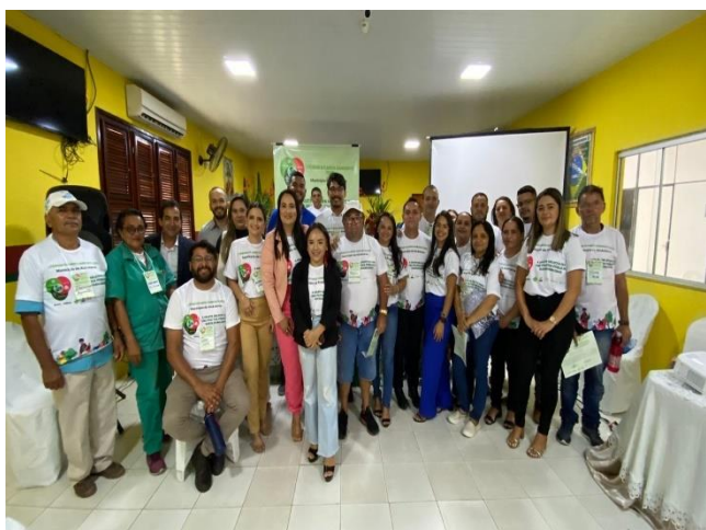
Figura 6- Participação em eventos dos municípios