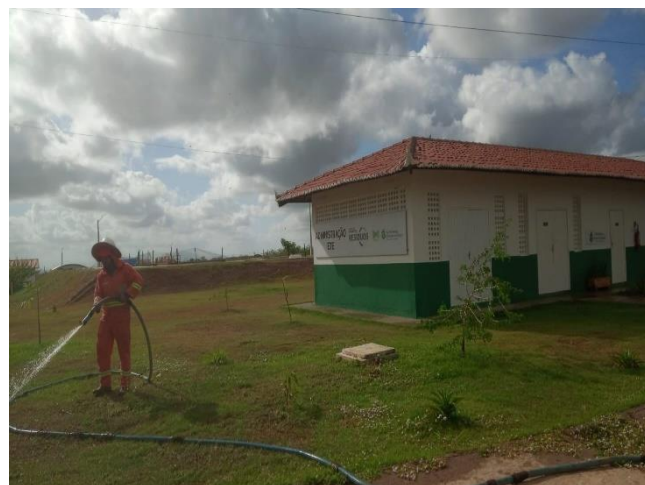
Figura 15- Irrigação dos jardins