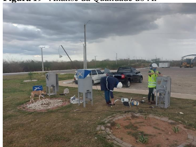
Figura 19- Análise da Qualidade do Ar