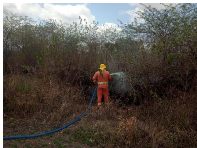
Figura 17- Operação de Combate a Incêndios