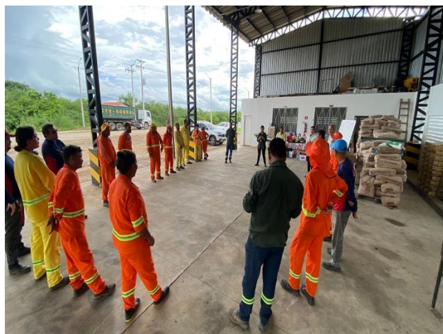
Figura 9- Gincana do dia do trabalhador