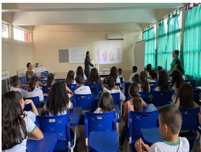
Figura 10- Treinamento para alunos no município de Graça