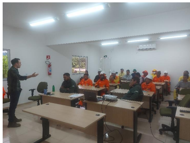
Figura 21- Início da implantação do DSS