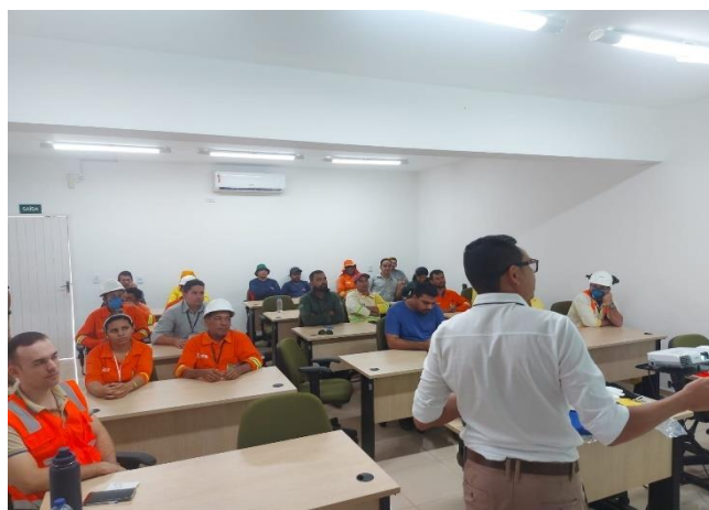
Figura 13- Treinamento NR – 36