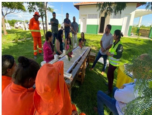
Figura 3- Comemoração do dia das mulheres