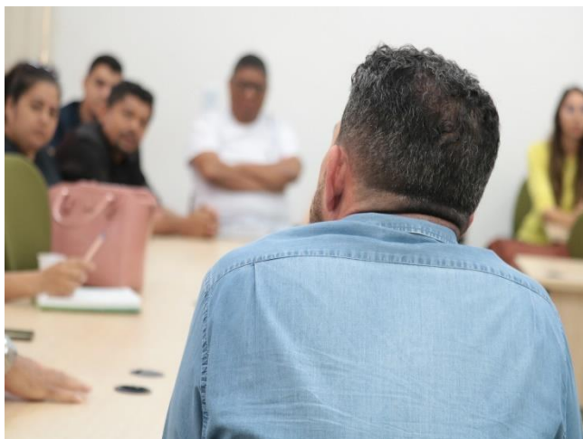
Figura 2- Reunião com os Técnicos dos municípios