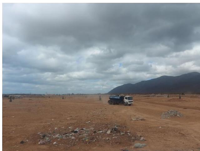
Figura 27- Irrigação das vias para diminuir a poeira