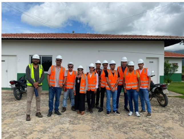
Figura 8- Visitas na CTR