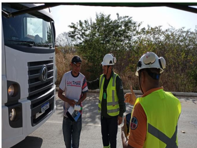
Figura 16- Ação no dia dos motoristas