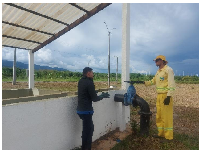
Figura 22- Início da Operação da ETE