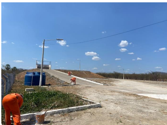
Figura 26- Pintura de Meio Fio ETR's