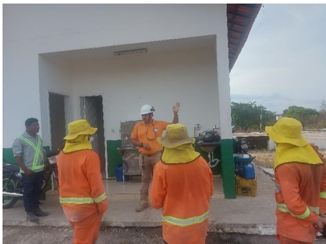
Figura 24- Treinamento sobre EPI'S e Resíduos