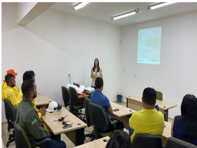
Figura 14- Abertura da Semana do Meio Ambiente