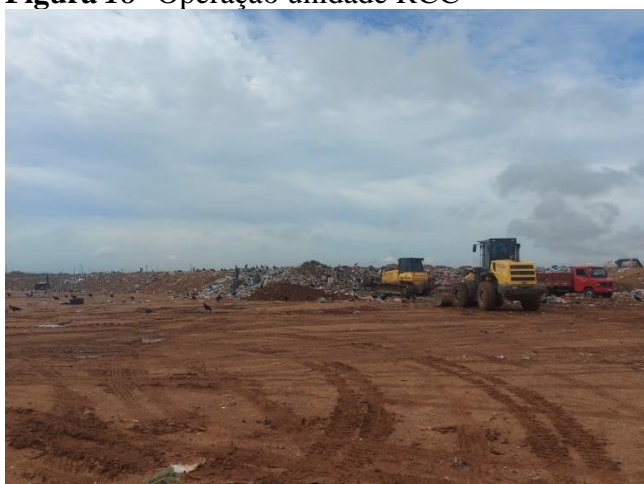
Figura 18- Operação unidade RCC