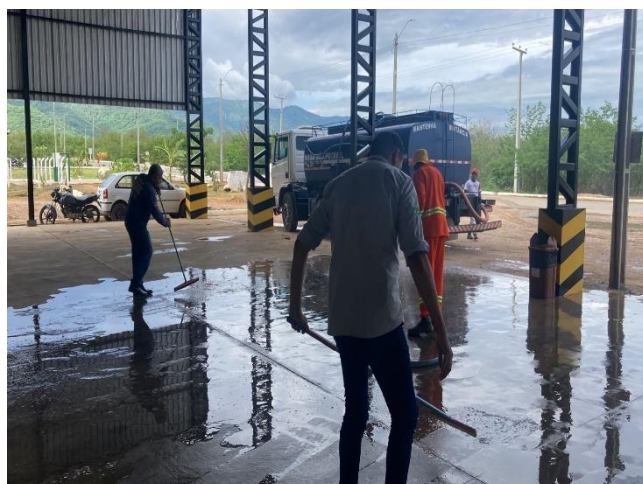
Figura 11- Manutenção no setor da oficina