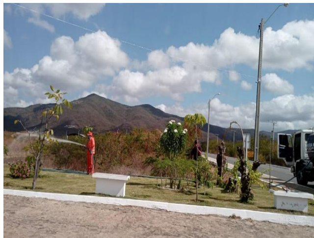
Figura 25- Irrigação de Jardins