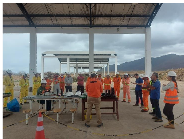
Figura 23- Treinamento NR-12